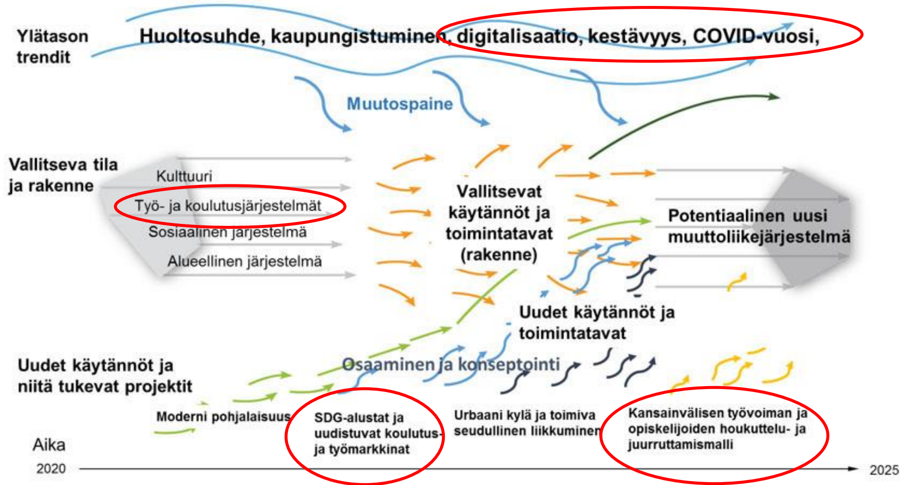
Kuva 1. Muuttoliikejärjestelmä ja sitä muovaavat tekijät